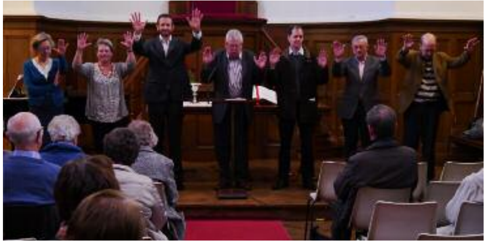
2014 : Quelques instantanés de la vie paroissiale