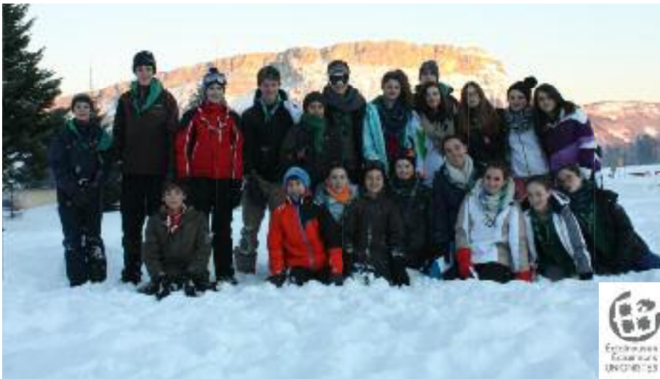
Le groupe des Eclaireuses- Eclaireurs Unionistes de Vélizy-Viroflay vous souhaite une excellente année 2015 depuis leur camp ski.

Théovie offre un parcours de formation libre et individualisé, avec possibilité d'un accompagnement. La formation peut être suivie individuellement ou dans un groupe. Le groupe Théovie de notre Eglise locale utilise les modules de façon particulière. Il fonctionne plutôt d'une manière autonome, à la manière d'un groupe de partage autour de la Bible. Les participants se réunissent une fois par mois le jeudi à 20h30 dans la salle annexe au temple de Jouy-en-Josas.